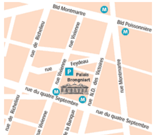
Palais Brongniart Place de la bourse – 75002 Paris

Reportez-vous au bulletin de réservation situé en annexe 5 OU Inscrivez-vous en ligne sur www.cncc.com