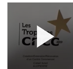
VOIR LA VIDÉO DE KLEPIERRE